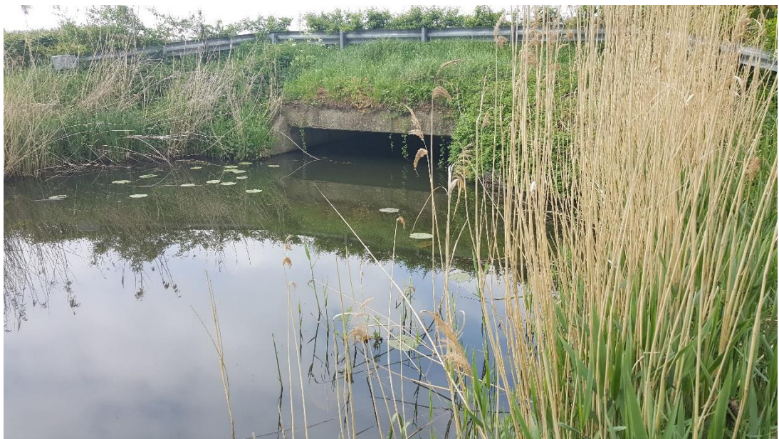
Figuur 2: Foto locatie tijdens veldbezoek op 1 mei 2019.