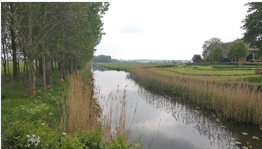
Figuur 5: Foto locatie tijdens veldbezoek op 1 mei 2019 (bovenstroomse zijde).