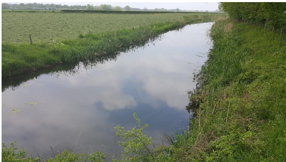
Figuur 6: Foto locatie tijdens veldbezoek op 1 mei 2019 (benedenstroomse zijde).