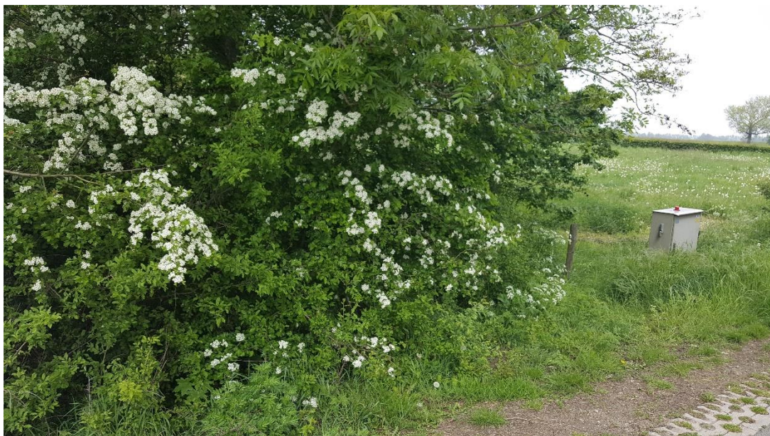
Figuur 4: Foto locatie tijdens veldbezoek op 1 mei 2019.