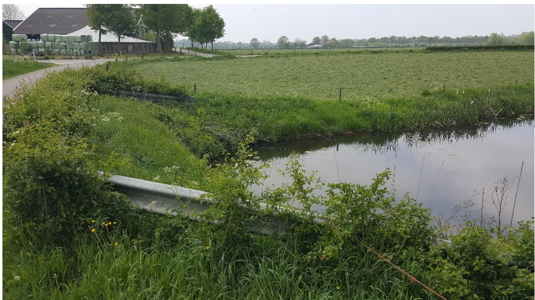
Figuur 3: Foto locatie tijdens veldbezoek op 1 mei 2019.